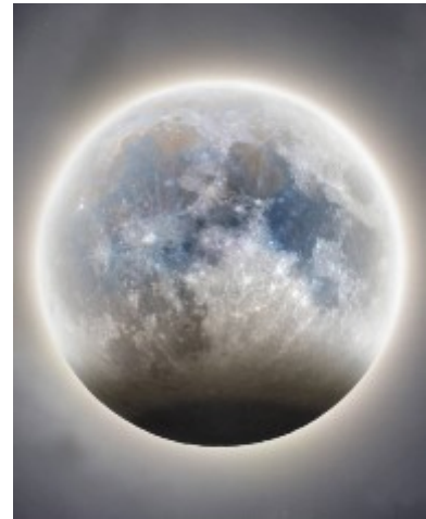
Рисунок 1. Снимок частного лунного затмения 28 октября 2023 года

В описании лунного затмения, произошедшего 28 октября 2023 года, на одном из интернет-сайтов было сказано: «...28 октября произойдет частное лунное затмение. Наблюдать его можно будет примерно в 22 часа, в Северном полушарии оно будет достаточно хорошо видно. Его длительность практически полтора часа. Луна в это время приобретет красноватый оттенок, так как ее частично закроет земная полутень».